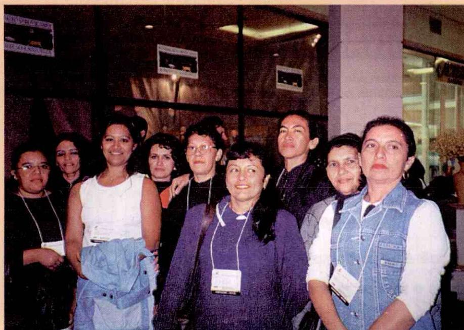
Micro-empresárias piauienses organizam caravana para participar da Fenit e conhecer tendências do mercado de confecção

CDL faz homenagem a lojista pioneira no Rio de Janeiro. Página 05